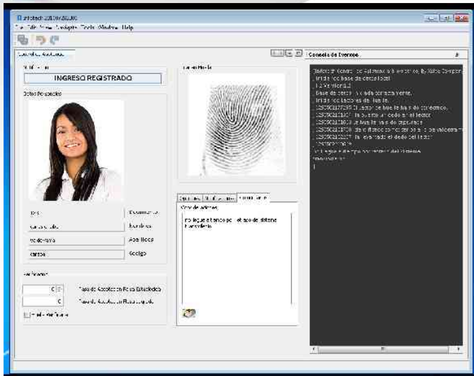
Fig 1. BOA. Pantalla Principal